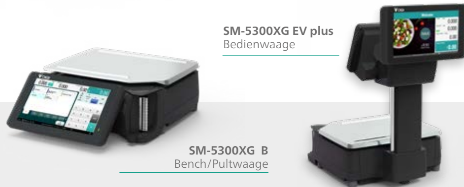
SM-5300XG EV plus Bedienwaage