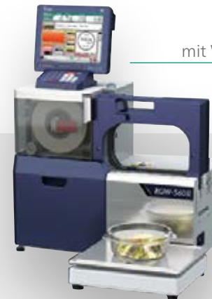
RGW-560IIS mit Wiegeplattform